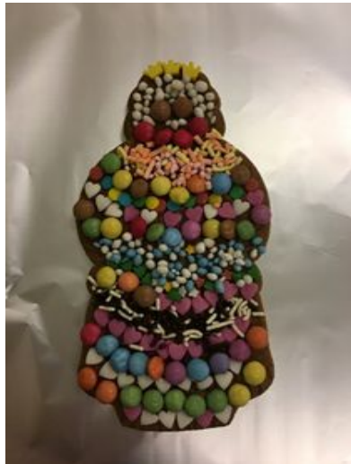
Speculaaspop van Rawaa

In de gezellige Sinterklaastijd heeft groep 5 samen met juf Annelies en juf Marjon speculaaspoppen versierd. Een gezellige middag. Alle kinderen waren heel enthousiast.